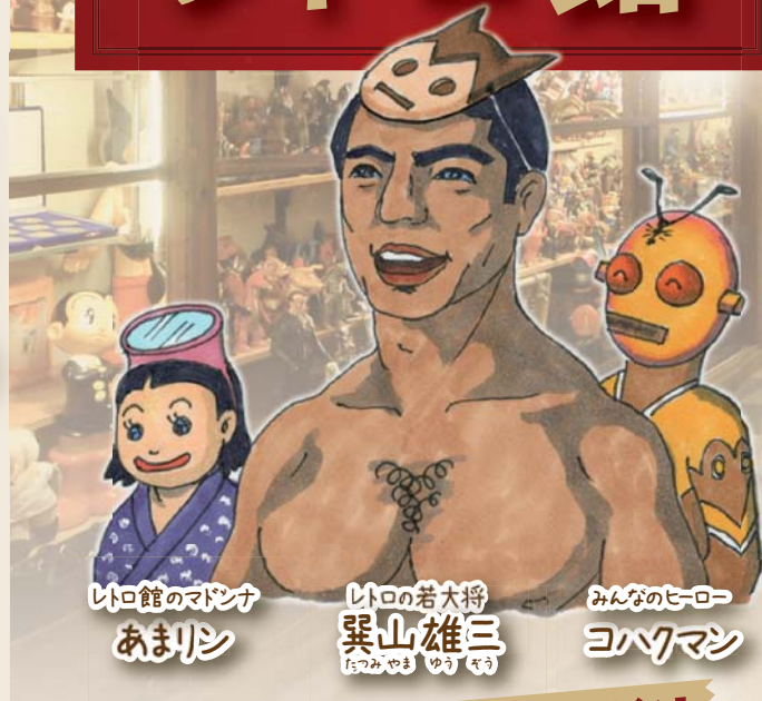
レトロ館のモダンな あまリン