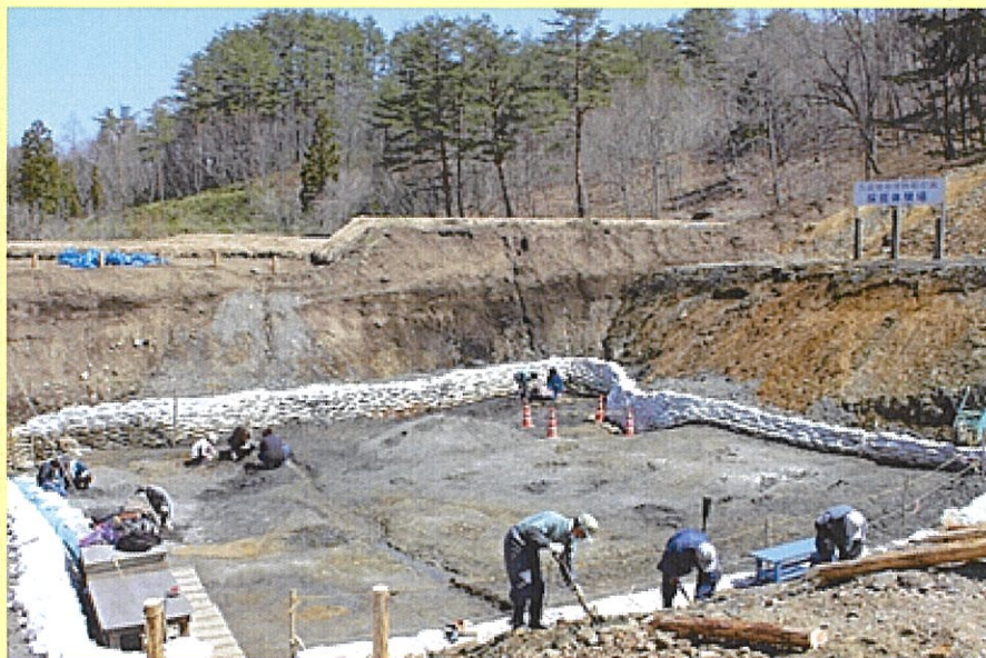
琥珀採掘体験場の様子

アイスピックとスコップを使い約9000万年前の地層を掘り起こして琥珀を探し出す体験です。本物の地層から宝石を取り出す世界でも珍しい体験は当館一番人気！長靴やスコップの道具類は全て無料貸出しているのので、気軽に体験が可能です。採掘した琥珀はお持ち帰りOK！