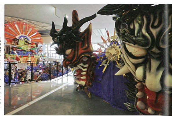
風の館にはロケでユイが身につけた装飾や山車が展示されている。