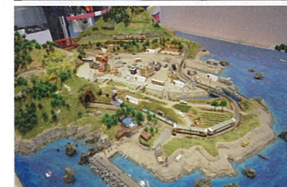
平成27年度に完成予定だった菅原観光協会会長ご自慢のジオラマ。