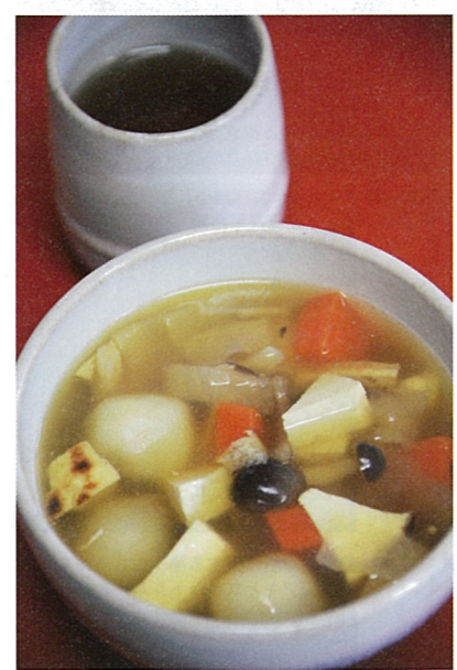
まめぶ汁単品800円、定食1080円。「味の宝石」食べていってける。

旧山形村の郷土料理。安部ちゃん言葉の借りれば「黒砂糖とクミミを入れた団子を、人参、豆腐、ゴボウ、シメジを醤油で味付けして煮た」もの。ドラマでは微妙な味を誇張していたが、実際は口の中で緊急会議は開かれず、真っ当さが逆に新鮮。●11～14時(土日祝～15時・夜は予約)、不定休。中央3-37 ☎0194・52・2617/☎080・1801・9960