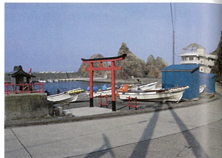
正宗のタクシーが停まり父娘が別れた場所●第10回。右端の小袖海女センターは4月26日新築再オープン。まめぶ汁も食べられる。