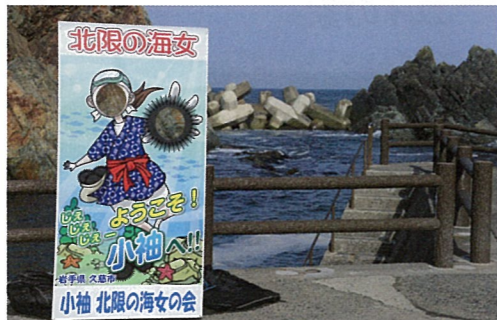
素潜り実演 & ウニの漁場●「小袖海女センター」横。実際もそう で7～9月に素潜り実演が。顔ハメで安部ちゃんになりきろう。

海女たちの坂●海女クラブの「いつでも夢を」の歌が聞こえてきそう。正面の建物が漁協や海女カフェの外観に使われ、フレディ花巻が熱唱した。正