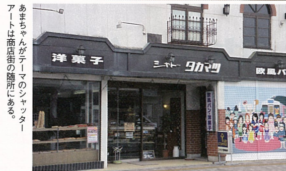
あまちゃんやシャトーのシャッターアートは商店街の随所にある。