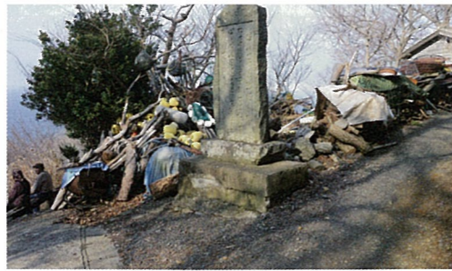
昭和八年津浪記念碑●監視小屋の少し上に立つ。右の路地を入ると夏ばっばの家がある設定だった。左端の女性は本物の海女さん。