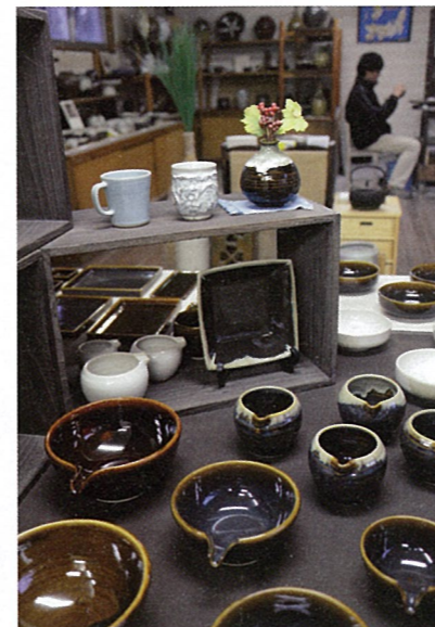
手になじむ名品。中央は実際に使われた夏の湯飲みと春子のカップ。

地場で採れる粘土と釉薬で作られる独創性の高い焼き物。江戸後期に始まり、200年以上の伝統を誇る。日用の雑器を中心に地元に広く親しまれ、八戸藩にも納められた。明治時代には柳宗悦に高く評価されている。リアスや夏ばっばの家などドラマの北三陸編で大活躍した。●9～18時、不定休。小久慈町31-29-1 ☎0194・52・3880