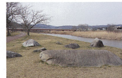
第13回でアキとユイが座って話をした河川敷の岩。赤い橋は大成橋。

アキとユイは北三陸駅から自転車で大成橋の左岸にある北三陸高校(場所は久慈高校)に通った。校内のロケは主に埼玉の寄居城北高校で行われ、潜水土木科の実習プールはずぶん先輩の名字でもある、お隣野町の種市高校が使われた。もしリアルに久慈駅からこの2校に自転車通学しようとしたら並外れた健脚がいるだろう。●畑田第26地割