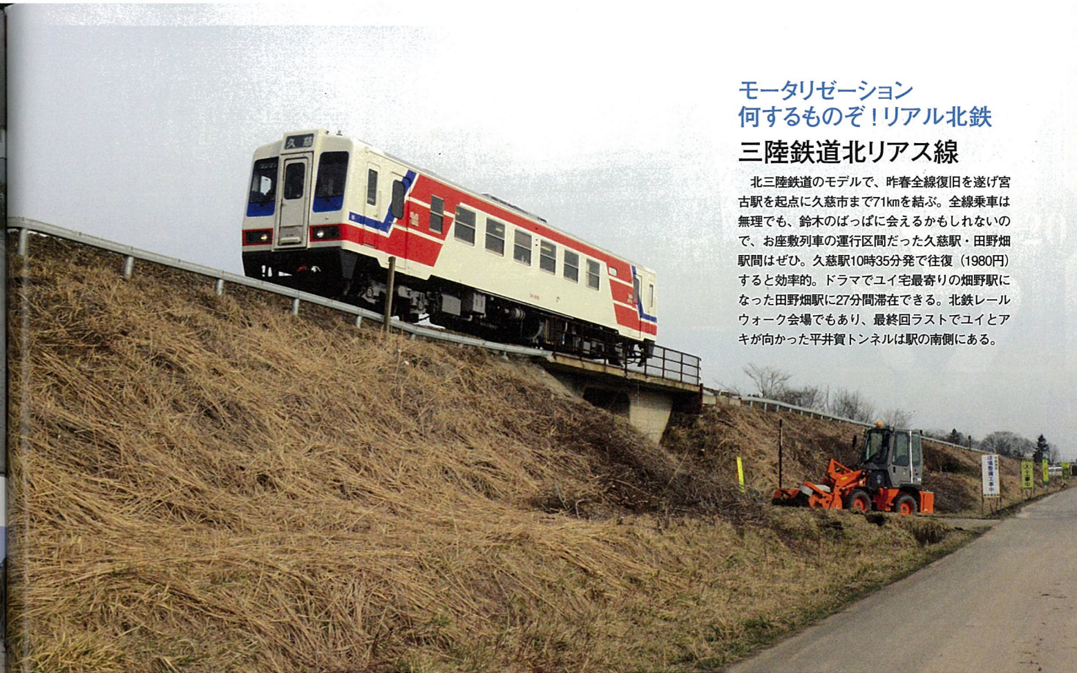
田んぼ沿いの道●オープニングで使われ、アキが自転車で気動車と並走したり復旧後に住民が歓待した道。陸中宇部駅-陸中野田駅間、山側に現れる。