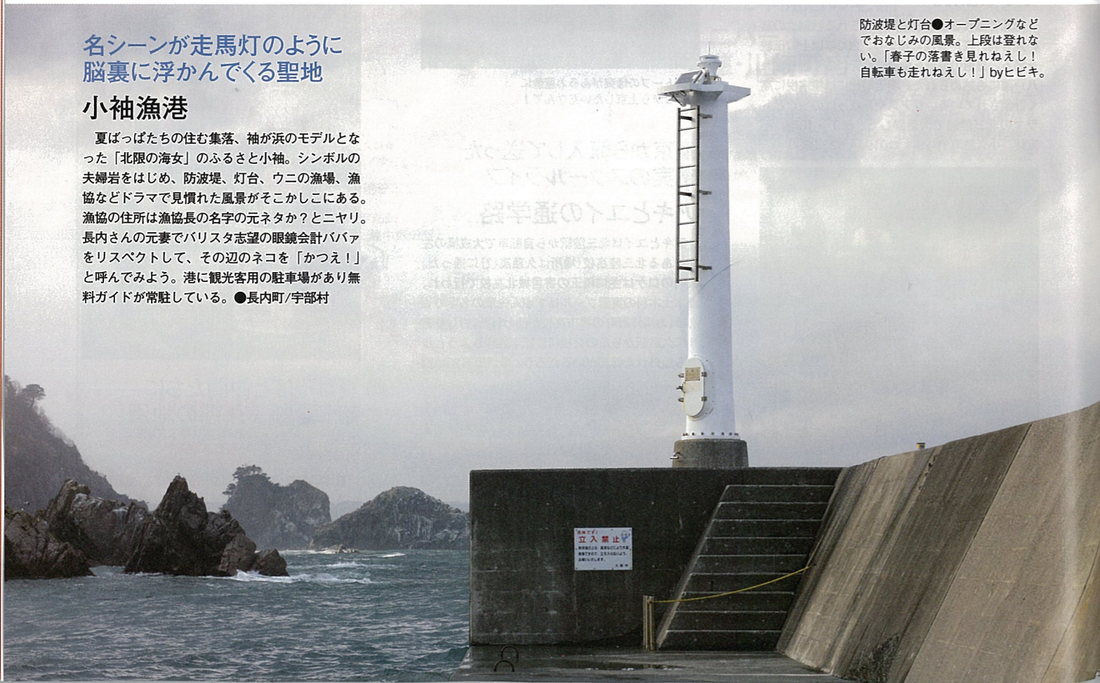
防波堤と灯台●オープニングなどでおなじみの風景。上段は登れない。「春子の落書き見れねえし! 自転車も走れねえし!」byヒビキ。

夏ばっばたちの住む集落、袖が浜のモデルとなった「北限の海女」のふるさと小袖。シンボルの夫婦岩をはじめ、防波堤、灯台、ウニの漁場、漁協などドラマで見慣れた風景がそこかしこにある。漁協の住所は漁協長の名字の元ネタか?とニヤリ。長内さんの元妻でパリスタ志望の眼鏡会計ババアをリスペクトして、その辺のネコを「かつえ!」と呼んでみよう。港に観光客用の駐車場があり無料ガイドが常駐している。●長内町/宇部村