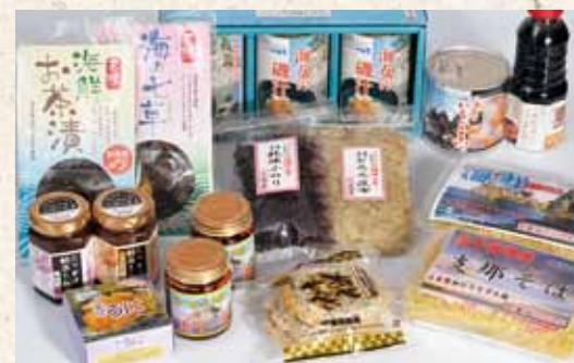
久慈のこだわり加工品