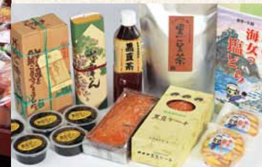
岩手県産 100%の黒豆製品