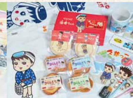
ご当地キャラクターグッズ