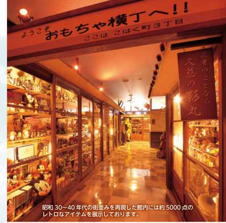
昭和30~40年代の街並みを再現した館内には約5000点のレトロなアイテムを展示しております。