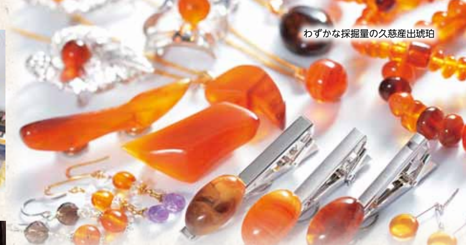
わずかな採掘量の久慈産琥珀