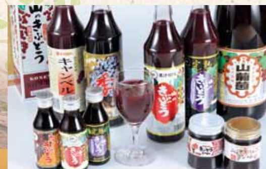
栄養豊富な山ぶどう製品